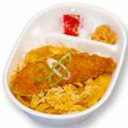
ササミカツとじ丼