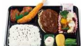
特上洋風デラックス