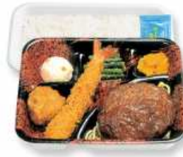
デミグラスハンバーグ セット (エビ・唐揚)