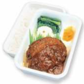
デミグラスハンバーグ弁当