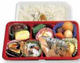
さわら西京焼幕の内