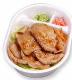
豚しょうが焼き丼