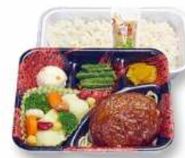
デミグラスハンバーグ セット (温野菜)