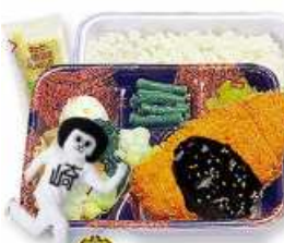
味噌かつセット (温野菜)