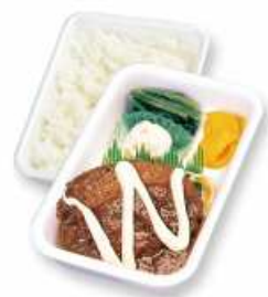
チーズハンバーグ弁当