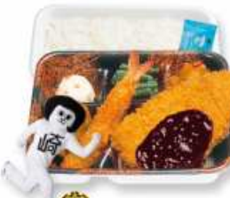
味噌かつセット (エビ・唐揚)