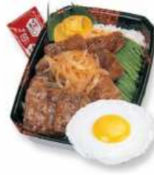
BMデラックスすて〜き重