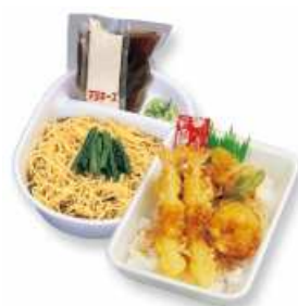
冷しラーメン定食