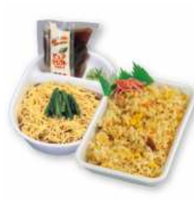
冷しラーメン+チャーハン