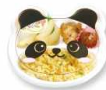
パンダチャーハン