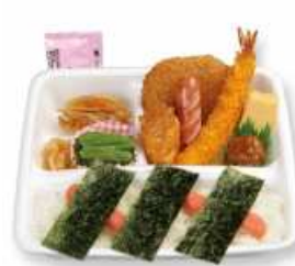
スポーツめんたい