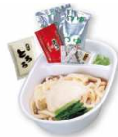
冷し山かけうどん