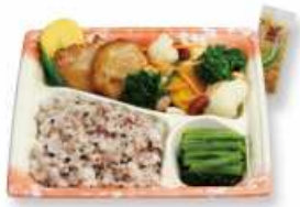
チキン温野菜弁当