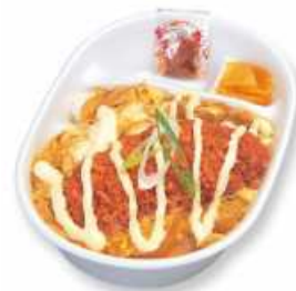
チーズササミカツとじ丼