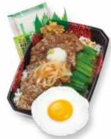
BMデラックスおろしすて〜き重