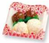
ミートボールとポテトサ ラダ