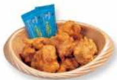
からあげバスケット