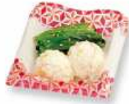
おひたしとポテトサラダ