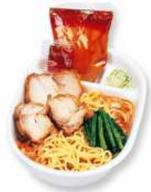
冷しとり肉 坦々まぜそば