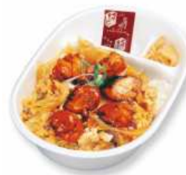
炭火ヤキトリ親子丼