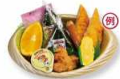
おにぎりバスケット