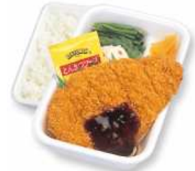
ローズかつ弁当（ソース）