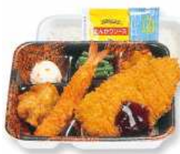
ローズかつセット (ソース・エビ・唐揚)