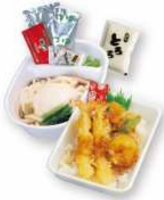
冷し山かけうどん定食