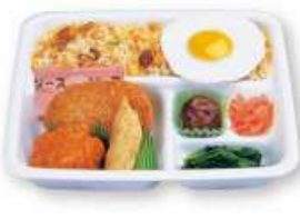
チャーハン祭り弁当