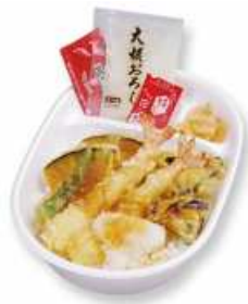
夏野菜おろし天丼