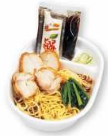
冷しとり肉ラーメン