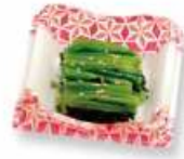
ほうれん草のおひたし