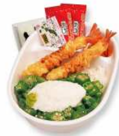
エビ山かけオクラ丼