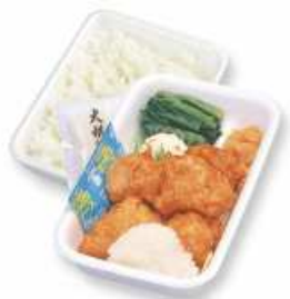
おろしからあげ弁当