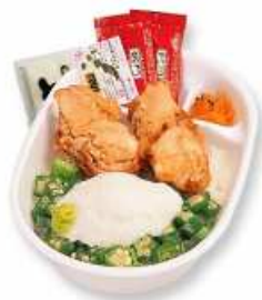
とり山かけオクラ丼