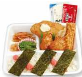
のりからめんたい