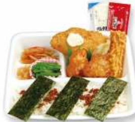
のりからデラックス