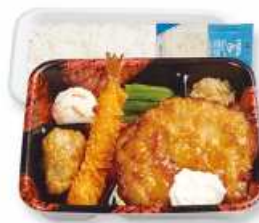
チキン南蛮セット (エビ・唐揚)