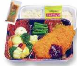
ローズかつセット (ソース・温野菜)