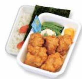
からあげめんたい