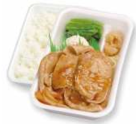
豚しょうが焼き弁当