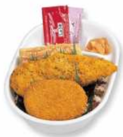
スーパーササミ丼