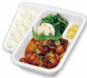
炭火ヤキトリ弁当